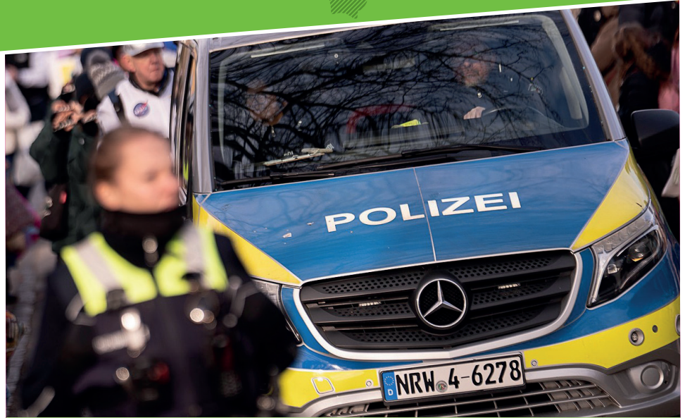
Das Polizeipräsidium Recklinghausen hat den Kriminalitätsbericht für das vergangene Jahr vorgestellt.

Auch bei der Ausstattung wurde auf durchdachte Details geachtet. Da auf den Spielflächen nur begrenzt Platz für größere Bäume vorhanden ist, wurden spezielle „Schatten-Blätter“ installiert, die vom Spielgerätehersteller entwickelt wurden.